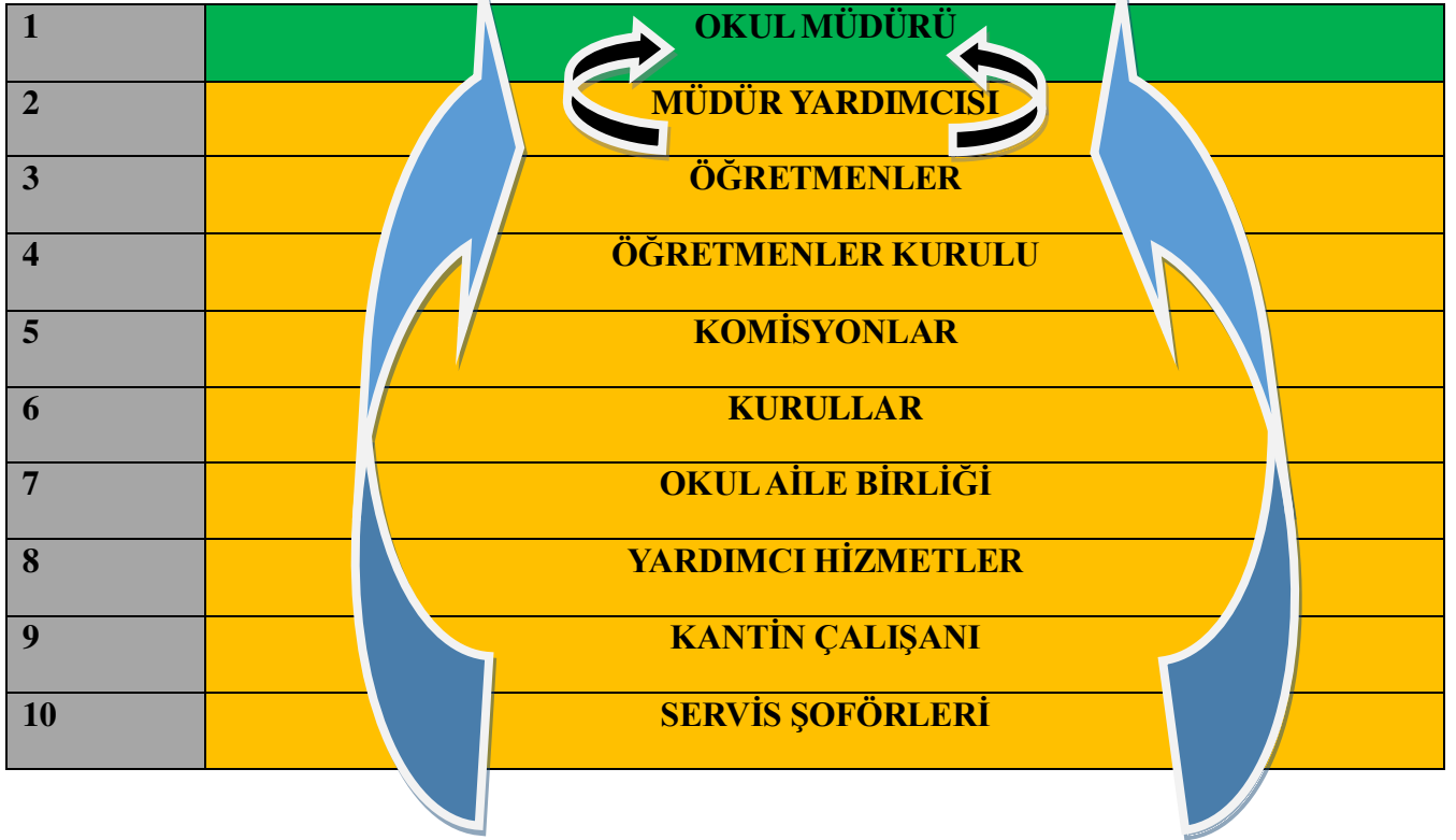
2.7.1.1.Tablo 9. Okulda Oluşturulan Birimler